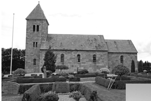
Tv.: Øster Tørslev kirke