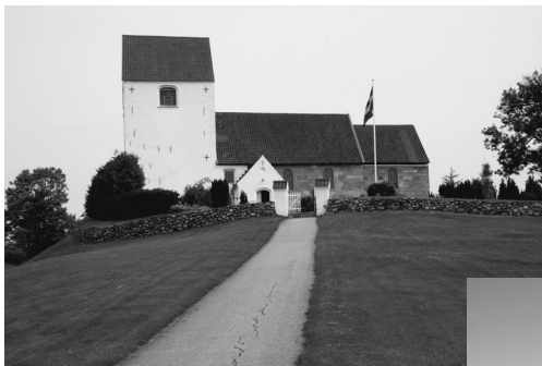
Øverst: Støvringgård Klosterkirke Tv.: Tvede kirke