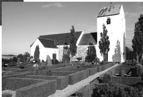
Th.: Gjerlev kirke