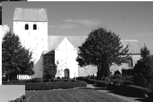
Th.: Hald kirke