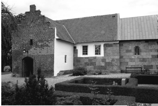
Tv.: Mellerup sognekirke