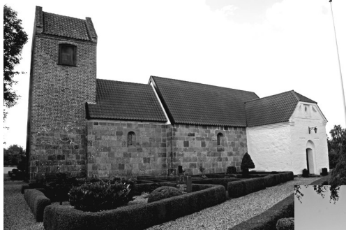
Tv.: Kærby kirke