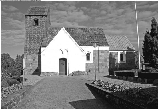
Th.: Enslev kirke