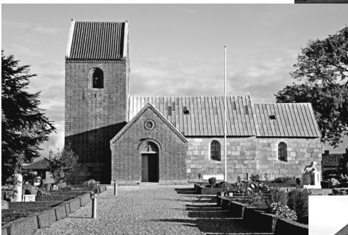
Tv.: Dalbyover kirke