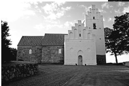
Tv.: Dalbyneder kirke