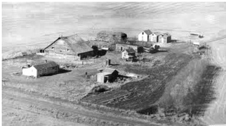
Gården i Canada i 1926