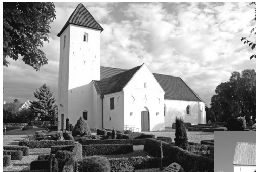
Tv.: Sødning kirke