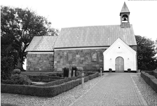
Tv.: Støvring kirke