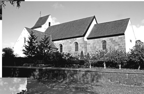
Th.: Linde kirke