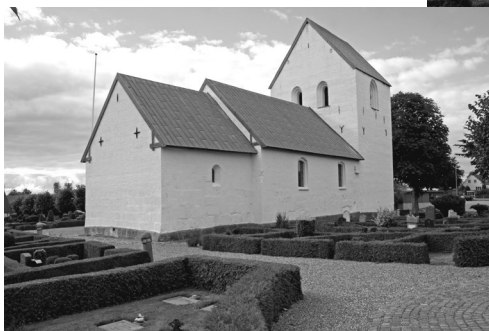
Tv.: Harridslev kirke