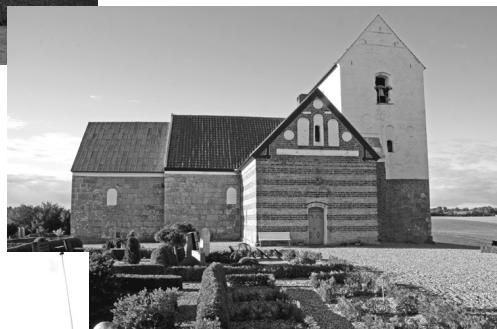
Th.: Råby kirke