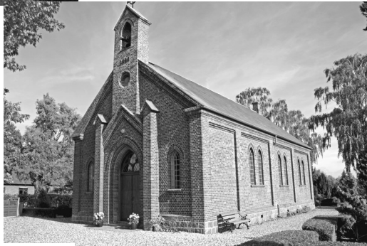
Th.: Mellerup Valgmenighedskirke