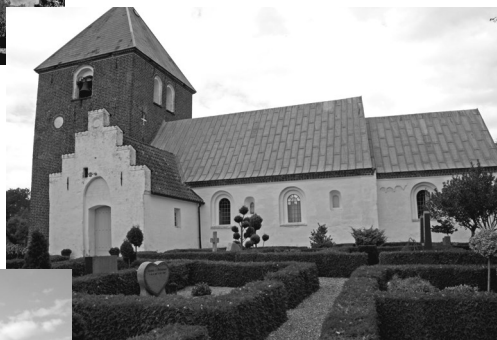
Th.: Albæk kirke